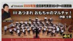
III あつまれおもちゃのマルチャ! 伊藤 士思