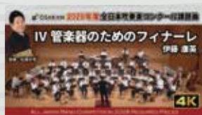
IV 管楽器のためのフィナーレ 伊藤 康英